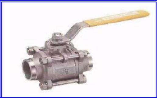
ШАРОВЫЙ КРАН - IT 308